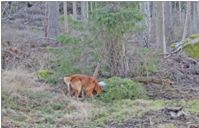
Hm, hur får jag ut dummyr här – den är ju instängd.

Om du har fem hundar från din uppfödning som beskrivits kan du beställa ett uppfödardiplom från SKK. När du