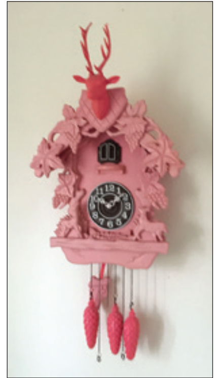
Helt crazy gökur i ett av grupprummen under kalibreringshelgen.

Förutom ett fast innehåll och program utgör kalibreringshelgen också ett utmärkt tillfälle att delge sina tankar