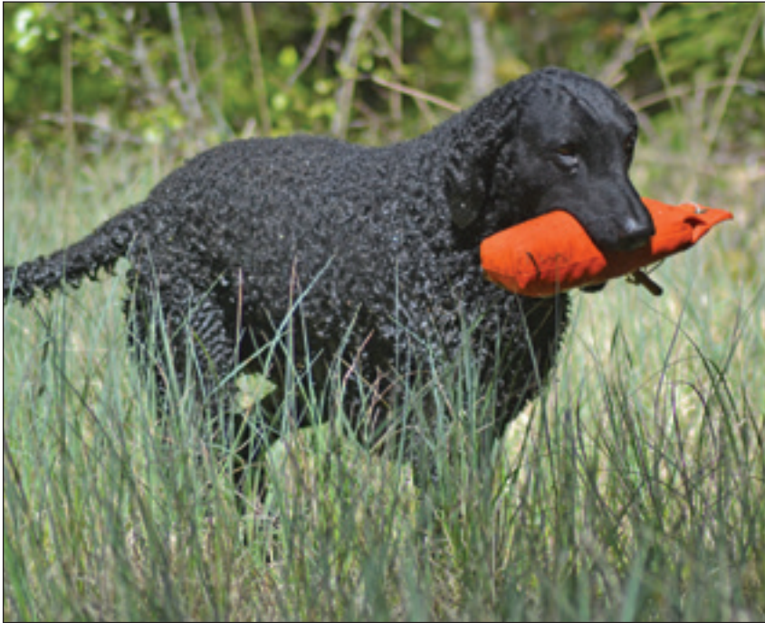
Vanlig dummy.