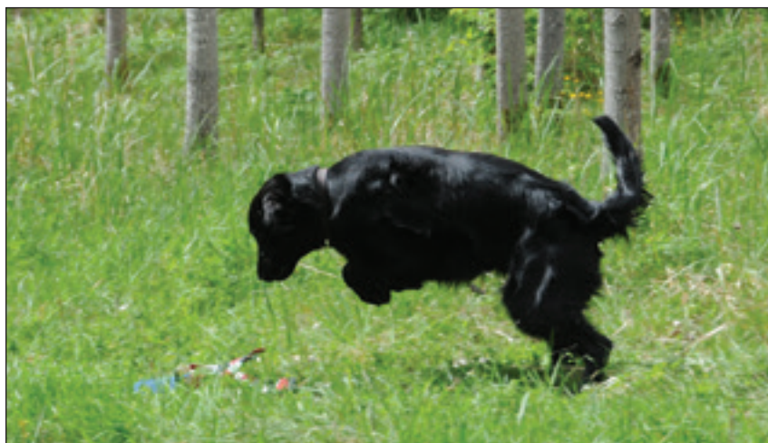
Dummy som far i väg.

Alla annonser och inbjudningar till FB-R med information om anmälan