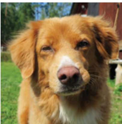
Fagerlands Röda Idefix de Amorex, "Idefix" med förare Frida Eklund

Det jag lärt mig av dagen är att ta med mig det som gick bra och inte fastna vid det som blev tokigt.