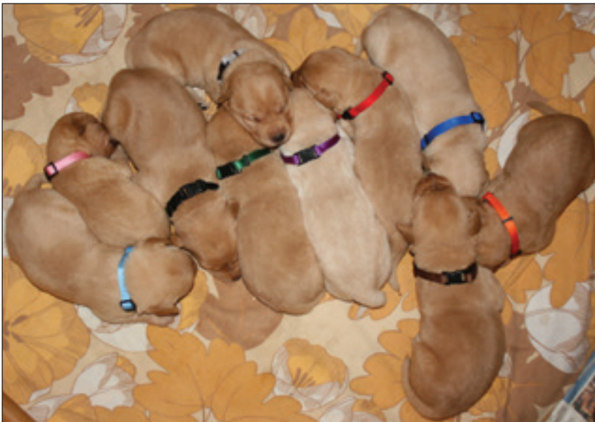
Lätt att hålla koll på 13 dygn gamla valpar.

Här är de 7 veckor och använde nästan uteslutande sin toalett när de behövde. ■